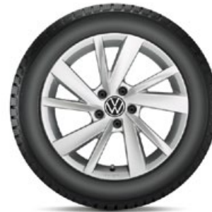
VW Gavia Silber