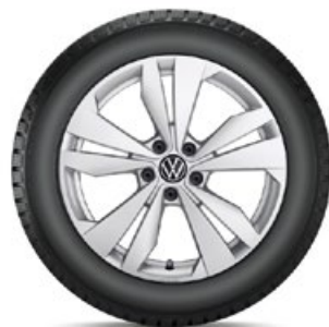
VW Loen Silber