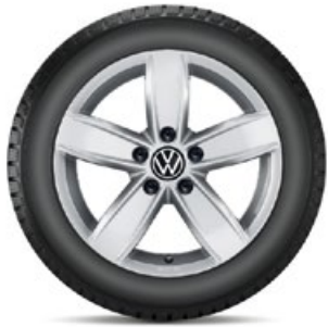
VW Corvara Silber