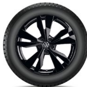
VW Loen Schwarz