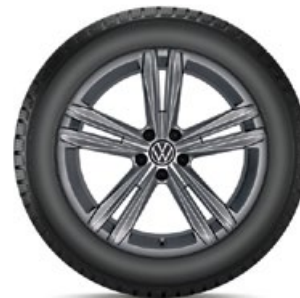
VW Sebring Grau