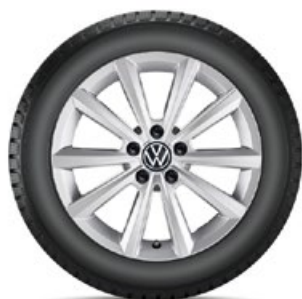
VW Merano Silber

1 Für Fahrzeuge mit Ausstattung „direkt messendes Reifendruckkontroll-System RDKS“