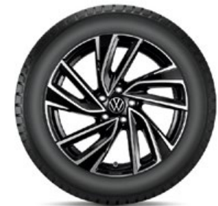
VW Adelaide Schwarz