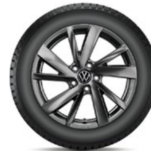
VW Gavia Adamantium Dark